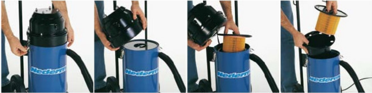
Rask og enkel tilgang for service av motor, partikkel filter og utskilleren