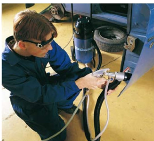
Den støvfrie sandblåsing påvirker ikke andre aktiviteter i verkstedet