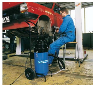
Fjerner rust, lakk og klargjør overflaten for fylling og lakkering