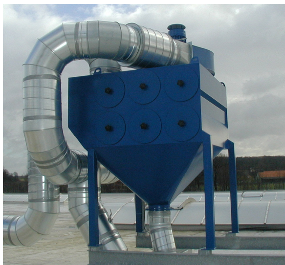
Stasjonært filteranlegg, kapasitet 22000 m 3 /h.